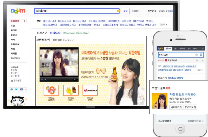
2. Daum 웹+모바일 브랜드검색 노출