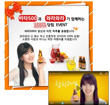
3. 브랜드 정보 추가 노출 (이벤트 응모/CF영상 Paly 등)