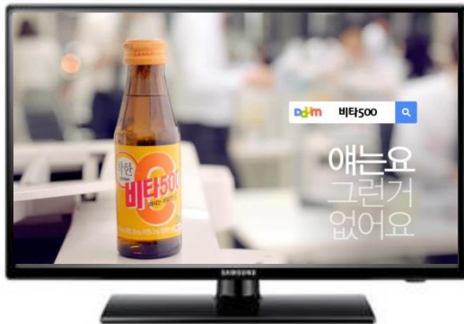
1. 오프라인 광고에 검색창 & 키워드 노출

의도된 캠페인 flow로 소비자를 유도하여, 브랜드 정보를 제공하는 효과를 얻으며, 동시에 파트너사는 오프라인 광고집행 금액에 따라, Daum 디지털 광고를 추가 집행할 수 있습니다.